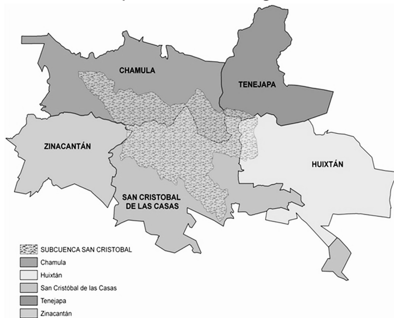
Mapa 1. Localización de la región de estudio

Zona de estudio: minicuenca del Valle de Jovel o subcuenca de San Cristóbal de Las Casas. Imagen creada usando ARCVIEW. Elaboración de Nora González Gurría y Daniel Murillo, 2012.